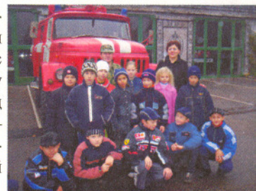
На экскурсии в пожарной части г.Тихорецка

Ученики 5-8 классов охотно рисуют плакаты по пожарной безопасности, посещают с экскурсиями пожарную часть. Им интересно своими глазами увидеть спасательное оборудование, работу пожарного со стволом и даже посидеть в пожарной машине.